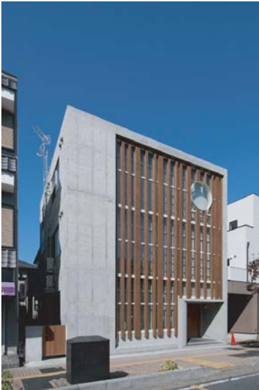
想像力を育む外観

当塾は、学習塾としての利用目的のみで建てられた専用塾舎です。他には類を見ない充実した学習環境下で、生徒たちの学習面でのサポートに全力で取り組んでいます。