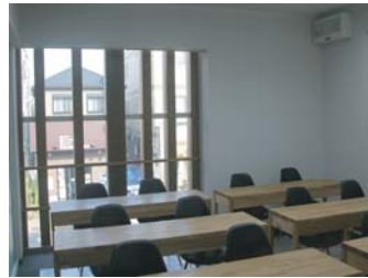
木のぬくもりあふれる教室