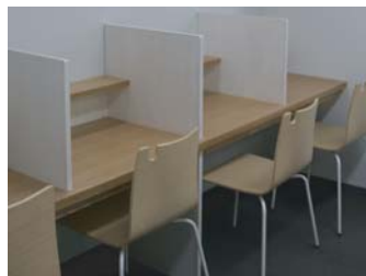
思わず集中してしまう自習室